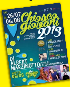
Illustrazione: Andrea Gatti. Responsabili per i diritti: Gatti & Gatti - Padova. Disegni: Gatti & Gatti - Padova.